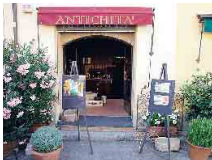
Alcune illustrazioni di Liza Schiavi esposte da Ceralacca Antichità in piazza Paolo a Rivergaro

Le altre poetiche tavole sono tutte supporto di due libri per